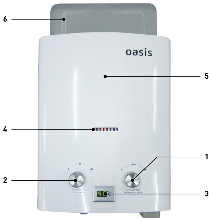
Рис. 1. Аппарат водонагревательный проточный газовый бытовой «OASIS» 1 - ручка водяного регулятора; 2 - ручка газового регулятора; 3 - цифровой индикатор температуры горячей воды; 4 - окно смотровое; 5 - облицовка; 6 - отражатель.

Составные части изделия, поясняющие принцип устройства аппарата и требующие технического обслуживания во время эксплуатации, показаны на Рис. 1.